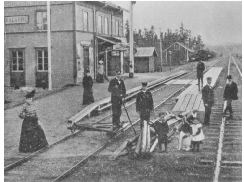
Kälarne Järnvägsstation anlades på ett obebyggt område mellan byarna Ansjö och Västane. Invigningen ägde rum på hösten 1883. Bilden är från 1910.