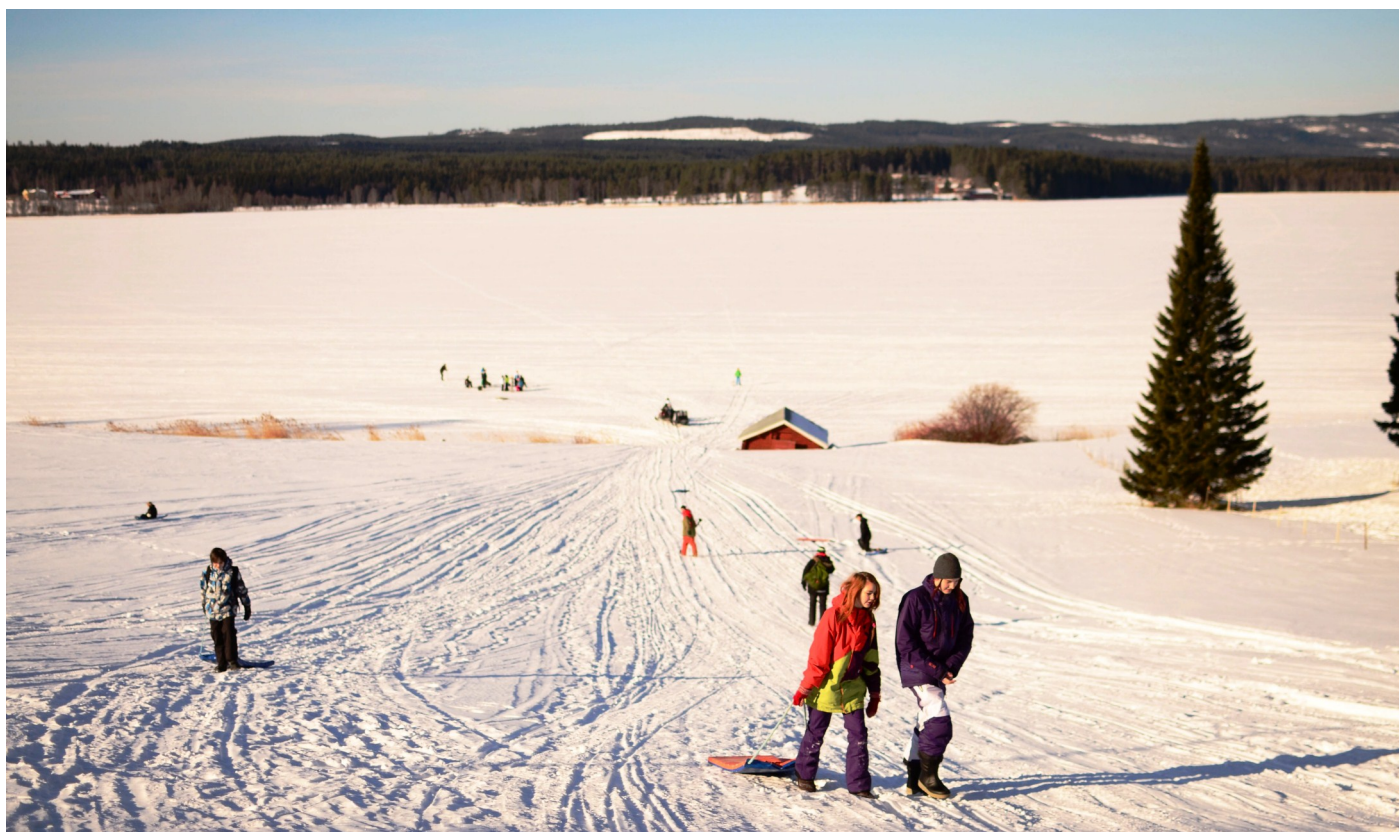
Bilder från de tjeckiska elevernas besök i Kälarne. Friluftsdag i Svedjebacken.